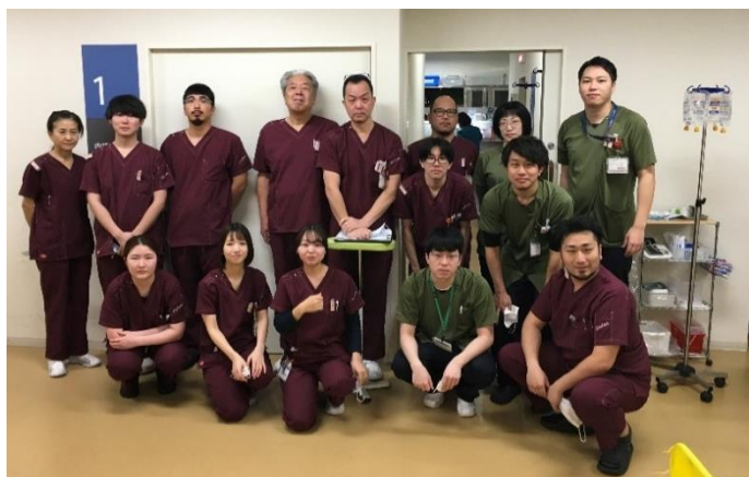
検査の依頼お待ちしております・放射線科一同